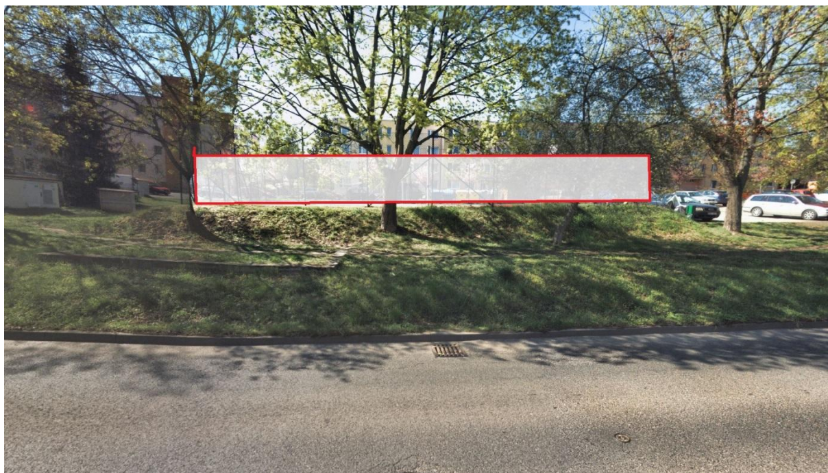
Oplocení hřiště v ul. Kralupská