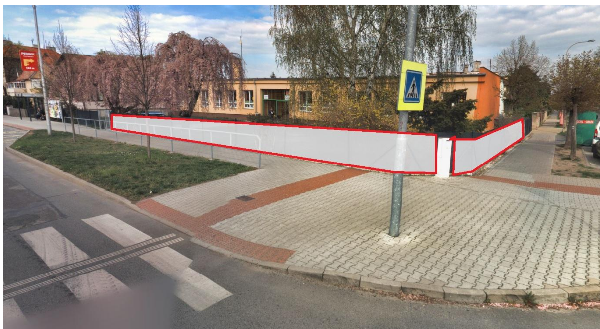
Oplocení MŠ Dr. Beneše, Stará Boleslav (ulice Boleslavská)